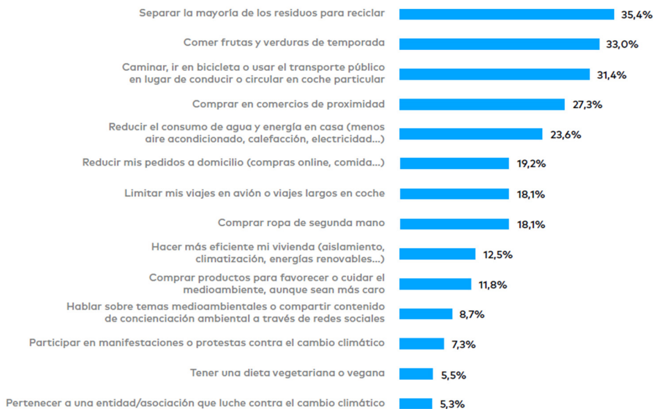
Gráfico I. Hábitos y comportamientos ya incorporados.

P44-57. Algunas acciones humanas pueden afectar al medioambiente... ¿Podrías indicar tu disposición a adoptar los siguientes hábitos o comportamientos para ser más sostenible con el medioambiente? 0) Nada dispuesto/a; 1) Poco dispuesto/a; 2) Bastante dispuesto/a; 3) Muy dispuesto/a; 4) Ya lo hago. (% de la categoría 4)